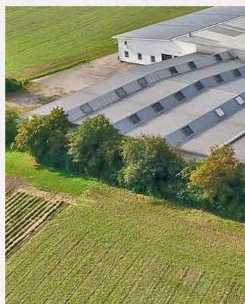
Vue aérienne du centre de traitement des commandes, Weiding