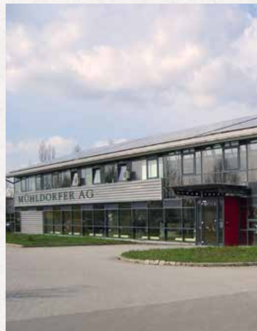
Siège social et usine 1, Mühlendorf