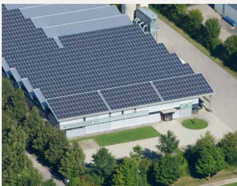
Vue aérienne de l'usine 1, Mühlendorf