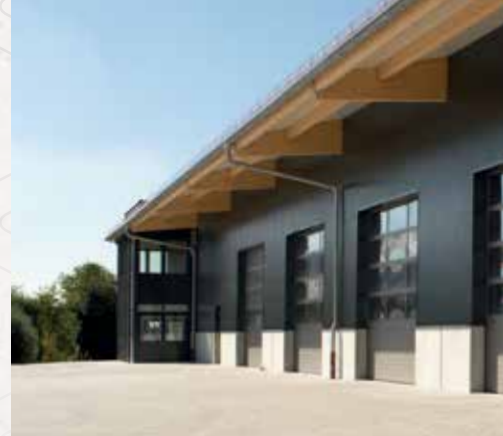
Usine 2, Mühlendorf

Fait pour le monde, chez lui en Bavière : JEGGO est une marque de Mühlendorfer Nutrition AG, dont le siège se trouve à Mühlendorf, en Haute-Bavière, en Allemagne. Depuis 1994, des produits émotionnels de haute qualité pour animaux de compagnie et chevaux y sont conçus et fabriqués avec vision, engagement, compétence et amour du détail. Lors du développement et de la production de nos produits, guidés par l'expérience accumulée de notre équipe, nous veillons toujours à utiliser des matériaux de haute qualité, les meilleurs ingrédients et à assouvir l'appétence pour l'animal. C'est ainsi que naissent des aliments pour animaux précieux, des produits de soin de première classe et des accessoires de haute qualité. Avec les marques de notre entreprise, Mühlendorfer Nutrition AG, nous proposons une gamme diversifiée de produits liés à l'alimentation et aux soins des animaux, ainsi qu'un portefeuille étendu d'équipements pour tous types d'animaux, que ce soit pour les chevaux, les chiens, les chats ou les poules. La grande majorité de nos articles sont fabriqués dans nos propres installations de production en Allemagne. Ces installations suivent des normes de traitement industrielles qui garantissent les plus hautes qualités de produits.