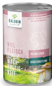
PUTE MIT KRÄUTERSEITLING DINDE AUX PLEUROTÉS