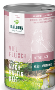
PUTE MIT KRÄUTERSEITLING DINDE AUX PLEUROTÉS