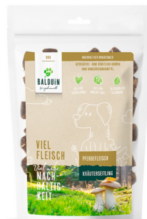
SNACK MIT PFERD MIT KRÄUTERSEITLING