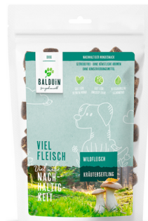
SNACK MIT WILD MIT KRÄUTERSEITLING