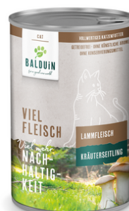
LAMM MIT KRÄUTERSEITLING AGNEAU AUX PLEUROTÉS