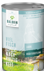
LACHS MIT KRÄUTERSEITLING SAUMON AUX PLEUROTÉS