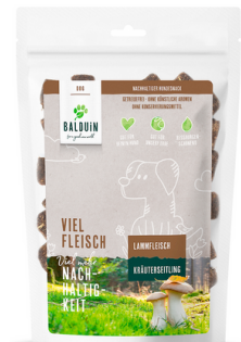
SNACK MIT LAMM MIT KRÄUTERSEITLING