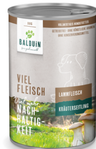
LAMM MIT KRÄUTERSEITLING AGNEAU AUX PLEUROTÉS