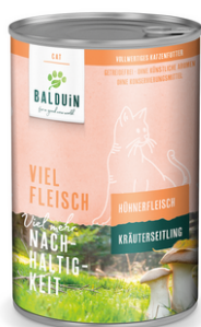
HUHN MIT KRÄUTERSEITLING POULET AUX PLEUROTÉS

La combinaison unique de viande et de pleurote cultivé en Autriche est traitée de manière particulièrement douce. Pour le bien-être des chats, tous les ingrédients sont soigneusement contrôlés. Aucun grain, arôme artificiel, colorant ni conservateur n'est utilisé. Ainsi, une alimentation très digestible, savoureuse et équilibrée est créée.