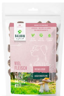
SNACK MIT PUTE MIT KRÄUTERSEITLING