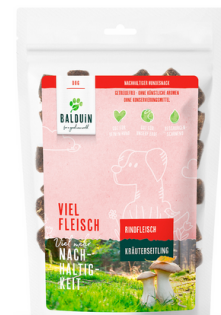
SNACK MIT RIND MIT KRÄUTERSEITLING