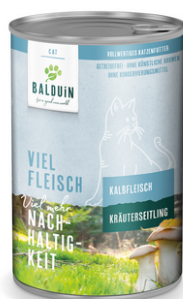
KALB MIT KRÄUTERSEITLING VEAU AUX PLEUROTÉS