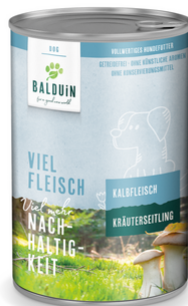
KALB MIT KRÄUTERSEITLING VEAU AUX PLEUROTÉS