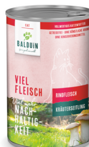
RIND MIT KRÄUTERSEITLING BŒUF AUX PLEUROTÉS