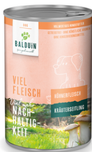
HUHN MIT KRÄUTERSEITLING POULET AUX PLEUROTÉS

La combinaison unique de viande et de pleurote cultivé en Autriche est traitée de manière particulièrement douce. Pour le bien-être des chiens, tous les ingrédients sont soigneusement contrôlés. Aucun grain, arôme artificiel, colorant ni conservateur n'est utilisé. Ainsi, une alimentation très digestible, savoureuse et équilibrée est créée.