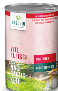
RIND MIT KRÄUTERSEITLING BŒUF AUX PLEUROTÉS