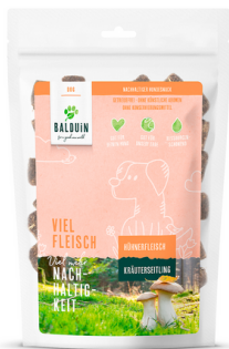
SNACK MIT HUHN MIT KRÄUTERSEITLING

La délicieuse et particulièrement digestible combinaison de viande et de pleurote cultivé en Autriche est traitée de manière particulièrement douce. Pour le bien-être du chien, les friandises de BALDUIN sont exemptes de céréales, d'arômes artificiels, de colorants et de conservateurs.